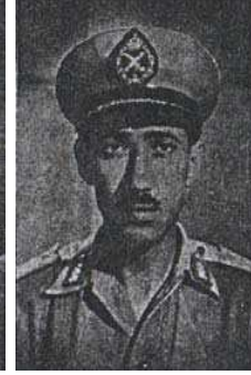
عبد الحكيم عامر